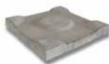
Dreentegel® 300 x 300 x 45 mm