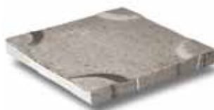
Dreentegel® 500 x 500 x 60 mm 600 x 600 x 60 mm