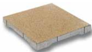
Dreentegel® 500 x 500 x 60 mm 600 x 600 x 60 mm