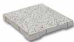
Dreentegel® 300 x 300 x 45 mm